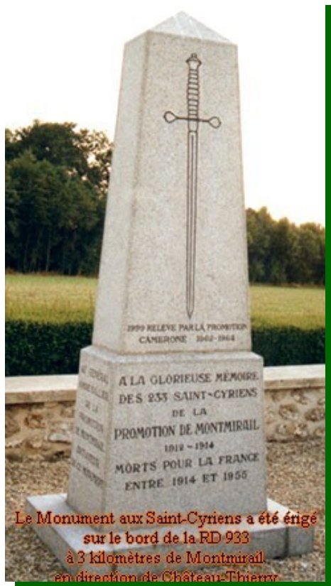
Jean-Marie Balleyguier Neuilly-lès-Dijon, septembre 2014

Depuis 1987 ils partagent le même caveau au cimetière du Montparnasse à Paris.